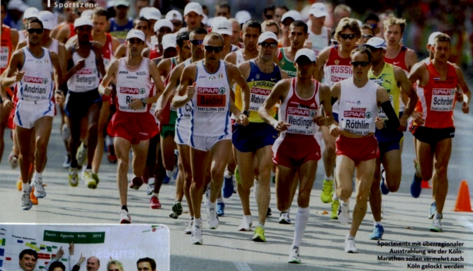
Sportevents mit überregionaler Ausstrahlung wie der Köln-Marathon sollen vermehrt nach Köln gelockt werden